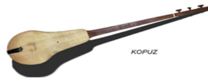
Şekil 1. Kopuz çalgısı

Kopuz çalgısı için tarih boyunca değişik teller kullanılmıştır. Bunlar, at kılı, bağırsak (kiriş), ipek ve metal tellerdir. Kırgız ve Kazak Türkleri, kopuzlarını ceviz ağacından yapmaktadırlar. Ceviz ağacının kopuz ve dolayısı ile saz yapımında kullanımı ise böylece başlamıştır. Yine Kırgız Türkleri kopuzlarını çam ağacından yapmışlardır. Bunun sebebi ise yaşadıkları çevrede çam ağacının yoğun olmasından kaynaklıdır. Altay ve Kuzey Türkleri ise sedir ağacından kopuzlarını yapmışlardır. Ancak bu kopuzlar rezonans ve ses bakımından çok iyi netice vermezler. Deri göğüslü kopuzlarda göğse gerilen deriler de çeşitlilik göstermektedir. Kırgızlarda kopuzun göğsüne deve derisi gerilmektedir. Bununla birlikte derinin sıcağa ve soğuğa karşı çok hızlı tepki vermesi, rezonans bakımından ağacın deriden daha iyi olması ve metal tel kullanımına geçiş ile birlikte tellerin göğüs üzerine çok fazla baskı yapıp derinin bu baskıya tepki verememesi sonucu kopuzlarda ağaç göğüs kullanımına geçilmiştir (Ögel, 1978).