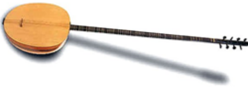
Şekil 3. Tambur çalgısı

Tambur (Tanbur); Türk Müsıkisinde ana eşlik sazı olarak önemli bir yere sahip olmuştur (Güneygül, 2020). Organolojinin uzun saplı lavta türünün tipik örneklerinden biri saydığı telli çalgıdır. Özbek ve Uygur müsıkisinde çalınan birbirine benzer iki çalgıdan başka İran'ın Luristan bölgesindeki Ehl-i Hak dergâhlarında, Kuzey Irak ve Suriye halk müsıkisinde kullanılan bağlama benzeri çalgılar da tambur (tanbûr) adını taşımaktadır (Karakaya, 2010).