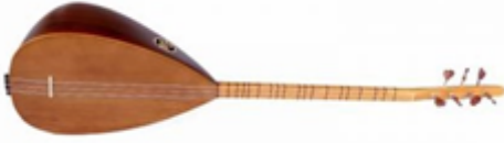
Şekil 2. Bağlama çalgısı

Tekne; bağlamadaki ses haznesi olarak da tanımlanmakta ve bu özelliği ile ses kalitesi açısından hayati önem taşımaktadır. Tekne yapımında genel olarak sert ve özgül ağırlığı yüksek olan ağaç (dut, maun, ardıç vb.) kullanımı ses kalitesini önemli bir oranda etkilemekte, iyi bir tını elde edilmesini sağlamaktadır. Göğüs kısmı “Sık elyafli ağaçlardan (kızılçam, ladin, köknar) yapılarak, tek parça olabileceği gibi, kenarlara başka renkli ağaçlar da konulabilir. Teknenin üstüne yapıştırılır. Tuşe bölümü parmak baskılarının gerçekleştirildiği ve perdelerin (ses ayraçları) üzerinde konumlandığı bölümdür. Tekneye bir takoz yardımıyla tutturulan tuşenin yapımında genellikle sert ağaçlar (kelebek, istiriç vb.) kullanılmaktadır. Bağlamanın perdeleri “Bağlamanın tuşesi üzerine genellikle dörtlü sarmal bir halde bağlanan perdeler, tuşe üzerinde seslerin yerinin belirlenme görevini üstlenirler”. Perdeler genellikle siyah renge boyanmış misinalarla yapılmaktadır ve tuşe üzerinde sabit değildir. Bağlamanın burguları sapın uç kısmındaki deliklere takılan ağaçtan yapılan burgular telleri germeye yarar. Her burguya bir tel bağlanır (İmik ve Haşhaş, 2020).