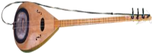
Şekil 4. Drabut çalgısı

Tekne kısmı kavak ağacından yapılmıştır, Gövde kısmında bulunan eşik bölümünde yayın balığı derisi kullanılmıştır. Tekne boyu 38 cm'dir. Tel olarak alta iki adet 0,18 ve bir adet ince sırma, ortaya iki adet 0,25, en üste de bir adet 0,18 ve bir adet kalın sırma takılır. Alt teller RE, orta teller SOL, üst teller LA olarak akortlanır.7 telli bir çalgıdır.